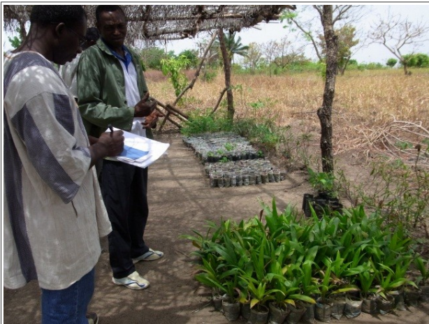
Baumschule in Togo

Ein Gemeinschafts-Projekt von Schulwälder für Afrika e.V. 1 , der URBIS FOUNDATION 2 und Partnerschaft für ländliche Entwicklung in Afrika e.V. (P.L.E.A.e.V.) 3 mit Unterstützung von Dietrich v. Tengg-Kobligk