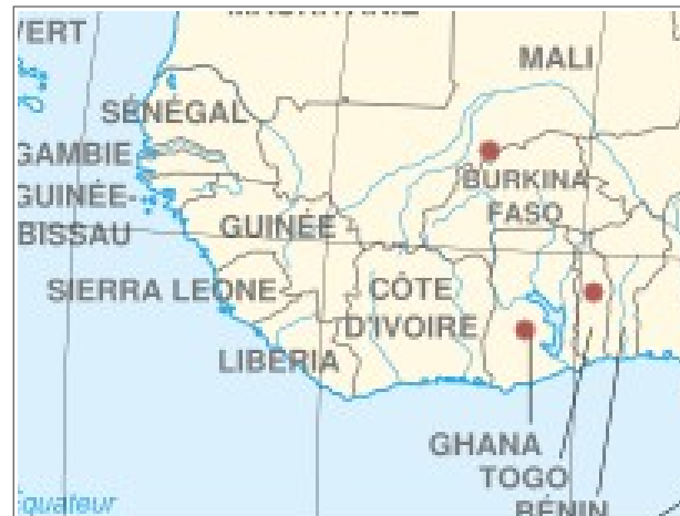
Pilotstandorte in Mali, Ghana und Togo

Ziel des Projekts ist der Nachweis der ökologischen, sozialen und wirtschaftlichen Verwendbarkeit der Waterboxx in Westafrika. Wird dies erreicht, soll von Jahr zu Jahr eine größere Anzahl von Menschen im Umgang mit der „Waterboxx“ geschult werden, damit der Bevölkerung eine Wiederbegrünung ihrer Region aus eigener Kraft gelingen kann.